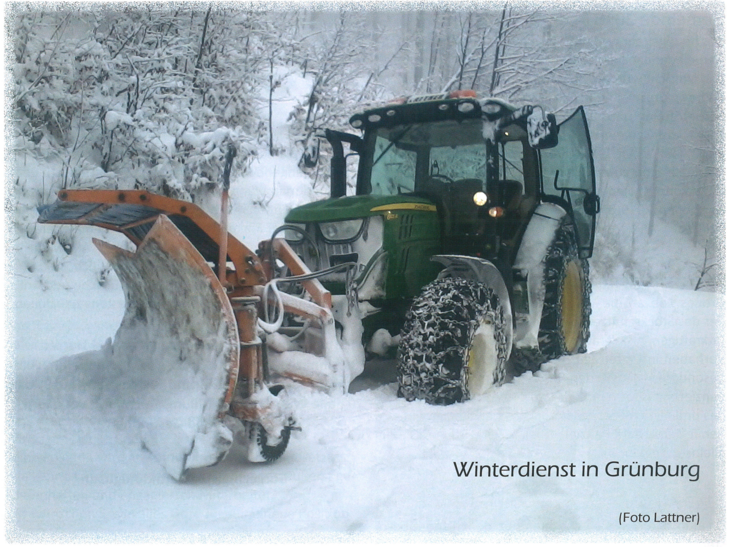
Winterdienst in Grünburg